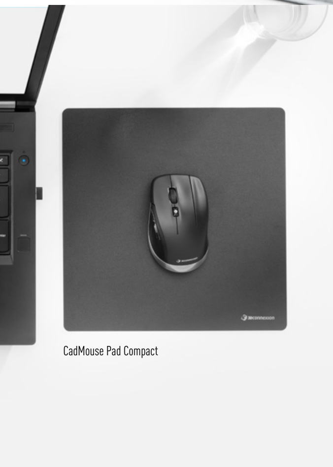
CadMouse Pad Compact

專用滑鼠中鍵 – 得益於 CadMouse 滑鼠的智慧人體工學設計, 點擊滑鼠滾輪的時代已成為過去。