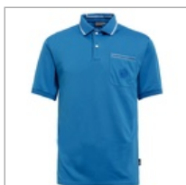
【hilltop山頂鳥】男款吸濕排汗銀纖維短 特價$990