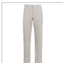
【hilltop山頂鳥】男款抗UV彈性合身長 特價$1390