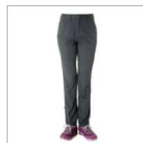
【hilltop山頂鳥】女款HITEC輕量吸濕快 特價$1806