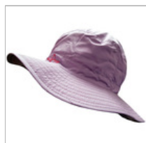
【hilltop山頂鳥】抗UV可收納帽 特價$490